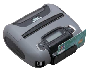
カードリーダー装備モデル