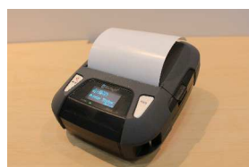
再剥離用紙対応(印刷時イメージ)